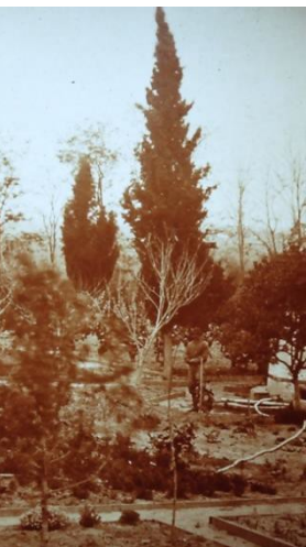
ទីល្ហា នៅផ្នែកខាងក្រោយ (1872)

ច្រកទ្វាចូល ក្លឹបខោនធី វើជីនញី (Virginia Country Club) : ដោយឈរ បែរខ្នងលោកអ្នក ទៅច្រកទ្វាចូលពណ៌បៃតង (នៅក្នុងកន្លែង ផ្លូវ រៀបកម្ព កាត់ផ្លូវដីហាប់ណែន) នោះលោកអ្នកនឹងមើលឃើញ វាលស្មៅលាតសន្ធឹង នៅកណ្តាលបរិវេណ និងផ្ទះធ្វើពីភ្នំកម្ពស់ ពីរជាន់ ។ ច្រកទ្វានេះ ជាច្រកទ្វារដ្ឋាល់ខ្លួន របស់ លេវេលីន ប៊ិកប៊ី ស៊ីប៊ី (Llewellyn Bixby Sr.) ចូលទៅកាន់ ក្លឹបខោនធី វើជីនញី (Virginia Country Club) ដែលនៅទីនោះ ប៊ិកប៊ី (Bixby) ជាសមាជិក សកម្ម មួយរូប ។ នៅខាងស្តាំដៃ របស់លោកអ្នក