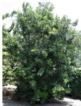
ដើមម៉ាកាដាម៉ាម៉េ (macadamia tree)

សួនច្បារដើម របស់ រ៉ាហ្វាអែលឡា & ចន ធូមផល (Rafaela & John Temple) អាស្រ័យ ទាំងស្រុង លើដើមឈើហូបផ្លែ និងលក់រាល់ ដែលអាចរកបាន នៅក្នុងស្រុក ដូចជា ដើមក្រូចមីសសួន (mission oranges) ដើមក្រូចឆ្មារលឿង ដើមទំពាំងបាយជូរ និងដើមទទឹម ។ នៅក្នុងទសវត្សរ៍ ឆ្នាំ 1930 រ៉ាហ្វា ខននៃល ស្ថាបត្យករផ្នែកទេសភាព (landscape architect Ralph Cornell) បានរៀបចំចម្ការមួយ នៅប៉ែកខាងត្បូងផ្ទះធ្វើពីឥដ្ឋនេះ ។ ការកំណត់ទីតាំងចម្ការ បានធានាថា ដើមឈើហូបផ្លែ ប្រកបដោយម្លប់ត្រឈឹងត្រឈៃ និងជួយផ្តល់ភាពត្រជាក់ ដល់ផ្ទះធ្វើពីឥដ្ឋ នៅផ្នែកនេះ នៅពេលអាកាសធាតុឡើងក្ដៅ ។ ផ្លូវដើរ កាត់តាមចម្ការ នាំទៅដល់ ទីធ្លាផ្នែកខាងក្រោយ ។ ជាងមើលផ្សេងទៀតលោកអ្នក អាចចូលទៅ ទីធ្លាផ្នែកខាងក្រោយបាន តាមទីចំណែក នៅទីធ្លាផ្នែកខាងមុខ ។