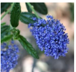
ផ្កាសេអាណូត (Ceanothus) រដូវផ្ការីក

អំបូររក្សាលំនឹងបរិស្ថាន (keystone species) របស់តំបន់នេះ គឺ ដើមស៊ីកាម៉ែ (sycamore) ដែលដើមវាមានសំបកពណ៌ស លក្ខណៈប្លែកខុសពីគេ ។ ម្លប់ ពីដើមស៊ីកាម៉ែ (sycamore) មានភាពទាក់ទាញស្លាកមិន ទោះបីជានៅពេលថ្ងៃក្តៅក្តី ។ នៅសងខាងផ្លូវដី លោកអ្នកនឹងសង្កេតឃើញ ចូលព្រឹក្ស ខ្ពស់ៗ ដែលមានស្លឹកតូចៗ ខៀវស្រងាត់ ។ នៅរដូវផ្ការីក ដើម សេអាណូត (Ceanothus) កាត់ពូជនេះ មានលំអ ទៅដោយកញ្ចក់តូចៗ ពណ៌ស្វាយ ចេញខៀវ (purple-blue flowers) ។ ជនជាតិចុងវ៉ា (The Tongva) បានប្រើប្រាស់ មែកសេអាណូត (Ceanothus) ជាចបជីក ។ ពួកគេបានប្រើប្រាស់ ផ្កាសេអាណូត (Ceanothus) ដែលជាពុះ (lather) ធ្វើជាសារី ។