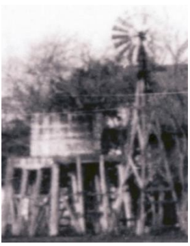
បំបែកទឹក (1921)

បំបែកទឹក : ទឹកស្អាត គឺជាស្នូលនៃជីវិតរស់នៅ ។ ពលករកសិដ្ឋានពីដើមឡើយ បូមទឹកចេញពីទន្លេ នៅក្បែរនោះ ដោយប្រើ ប្រព័ន្ធកម្លាំងសម្ពាធរុកទឹក (water ram) ។ វាមានប្រសិទ្ធភាព រហូតដល់ពេលគ្រោះរាំងស្ងួត បានធ្វើឱ្យទន្លេស្រកទឹក ។ ក្នុងអំឡុងទសវត្សរ៍ ឆ្នាំ 1860 គេជីវិត ថ្មីមួយ ។ វាមាន ម៉ាស៊ីនរុញដោយកម្លាំងខ្យល់ ដើម្បីបូមទឹក ឡើងទៅអាងរក្សាទឹក ឬ បំបែកទឹក ។ កសិដ្ឋាន រ៉ាញ់នូ ឡូស ស៊ីតូស (Rancho Los Cerritos) ត្រូវបានកក្កាប់ និងបណ្តាញទឹក របស់ទីក្រុង នៅទសវត្សរ៍ ឆ្នាំ 1930 ។ សូមបន្តដំណើរ តាមផ្លូវ រដ៏ ទៅមុខទៀត ដើម្បីទៅមើល ឡូចម្រាស់ដី (Horno) ។