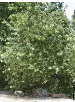
ដើមអែលប៊ី ប៊ើរី (Elderberry Tree)

នៅខាងស្តាំ ផ្នែកខាងចុង នៃរងនេះ, ដើមសែនមកពីតំបន់ឆ្នេរ (coast live oak) នៅ កែវផ្តល់ជាម្លប់ យ៉ាងត្រឈឹងត្រឈៃ ។ ដោយសារមនុស្ស និងដើមសែន មានទំនោរលូតលាស់ នៅក្នុងបរិស្ថាន ប្រហាក់ប្រហែលគ្នា, ផ្លែសែន បានបម្រើជា អាហារមូលដ្ឋាន របស់អារ្យធម៌នានា នៅជុំវិញពិភពលោក ។ ជនជាតិចុងវ៉ា (The Tongva) ក្រោយពេលធ្វើដំណើរការ ជុំវិញដែនរងនេះរួច សូមបន្តដំណើរឡើងដំណើរ នៅខាងឆ្វេងដៃ របស់លោកអ្នក ដើម្បី ចាកចេញ ពីសួនច្បារនេះ ។