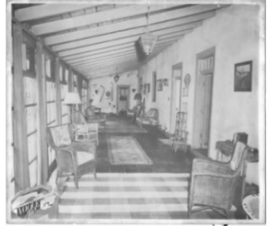
រាងហាល មានប្រក់ដំបូល (1954)

បន្ទប់កេង : ក្នុងពេលធ្វើនវានុវត្តន៍ នៅអំឡុងទសវត្សរ៍ ឆ្នាំ 1930, បន្ទប់នេះ បានក្លាយទៅជា អង្គឯកកាផ្ទះ មាន បីបន្ទប់ (three-room suite) សម្រាប់កូនប្រុស របស់ អារីស & លេវេលលីន ប៊ិកប៊ី ស៊ីញី (Avis & Llewellyn Bixby Sr.) ។ នោះរួមមាន បន្ទប់ទទួលភ្ញៀវ បន្ទប់កេង និងបន្ទប់ទឹក ។ វាក៏មាន ប្រព័ន្ធអគ្គិសនី ទឹក និងកម្ដៅផងដែរ ។ បង្អួចមានរាងដូចជីវឡាវ ដែលស្ថិតនៅផ្នែកខ្ពស់ នៃជញ្ជាំង បង្ហាញថា បង្អួចនេះ ធ្លាប់ជា ផ្នែកនៃ រោងជាងដែក ។