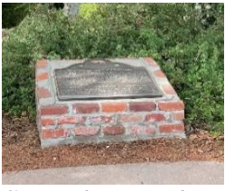
ទីតាំងភូមិសាស្ត្រប្រវត្តិសាស្ត្រ (Historic Marker)