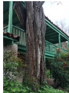
ដើមអាកាស្យា ខ្មៅ (Black Locust Tree)