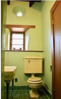
បន្ទប់ទឹក ក្នុងអំឡុងទសវត្សរ៍ ឆ្នាំ 1930 ។

ម្ចាស់ : មានមនុស្សពីរម្នាក់ ទៅ សាមសិបនាក់ជាង បានរស់នៅ ក្នុងកសិដ្ឋាននេះ ក្នុងសតវត្សរ៍ ទី 19 ហើយជាដើម ត្រូវបានមកស្នាក់អាស្រ័យ ម្តងៗរាប់សប្តាហ៍ ។ ហេតុនេះហើយ ទើបមានបន្ទប់ច្រើន នៅស្ថាបត្យកម្មនៃផ្ទះ ដើម្បីទុកដាក់ ចំណីអាហារ គ្រឿងសង្ហារឹមបន្ថែម បរិក្ខារទឹកដោះកោ អុស និង គ្រឿងសម្អាតផ្ទះផ្សេងៗទៀត ក្នុងបរិមាណច្រើនៗ ។ ពីដើមឡើយ មានបីបន្ទប់ ដែលផ្នែកនេះ នៃស្ថាបត្យកម្មនៃផ្ទះ បានក្លាយទៅជា បន្ទប់ស្នាក់នៅ សម្រាប់ភ្ញៀវ ចំនួន ពីរបន្ទប់ នៅក្នុងអំឡុងទសវត្សរ៍ឆ្នាំ 1930 ដែលបន្ទប់នីមួយៗ មានបន្ទប់ទឹក និង ទូ រៀងៗ ខ្លួន ។