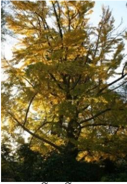
ដើម ហ្គីងកូ (Ginkgo Tree)

សុនច្បារ ប្រកបដោយម្លប់ក្រលីងក្រលៃ : ថ្នាលដាំរុក្ខជាតិ ដែលមានលើកថ្នាក់ ឱ្យខ្ពស់ ត្រូវបានរួមបញ្ចូល នៅក្នុងផែនការទេសភាព កាលពីទសវត្សរ៍ ឆ្នាំ 1930 ដើម្បីផ្តល់សុនដ្ឋា ស្រស់បំព្រង (fresh-cut flowers) សម្រាប់ផ្ទះ របស់ អាវីស & លេវេលីន ប៊ិកប៊ី ស៊ីប៊ី (Avis & Llewellyn Bixby Sr.) ។ ថ្នាលខ្លះ ត្រូវបានរៀបចំ សម្រាប់ផ្ការីក តាមរយៈ វិធានផ្សេងទៀត ដែលលូតលាស់ នៅក្រោមព្រះអាទិត្យ ។ ចាប់តាំងពីពេលនោះមក ដើមហ្គីងកូ (gingko) និងដើមល្វា (fig trees) មានម្លប់ក្រលីងក្រលៃ នៅកន្លែងនេះ ហេតុនេះទើបដើមផ្កា ក៏រីនឡើយ (perennials) ដែលធននឹងម្លប់ ក្នុងរយៈពេលសមស្រប ត្រូវបានយកដាំនៅទីនេះ នាពេលសព្វថ្ងៃនេះ ។ សូមបក់ តាមថ្នាល មានលើកថ្នាក់ឱ្យខ្ពស់នេះ ហើយបន្តដំណើរ របស់លោកអ្នក តាមផ្លូវ រដ៏ ដែលស្របនឹង ក្លឹបខោនធី ដែលលោកអ្នកអាចមើលឃើញនៅជិត ដើមហ្គីងកូ (gingko) ។